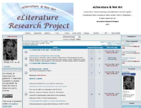
eLiterature & Net Art Community