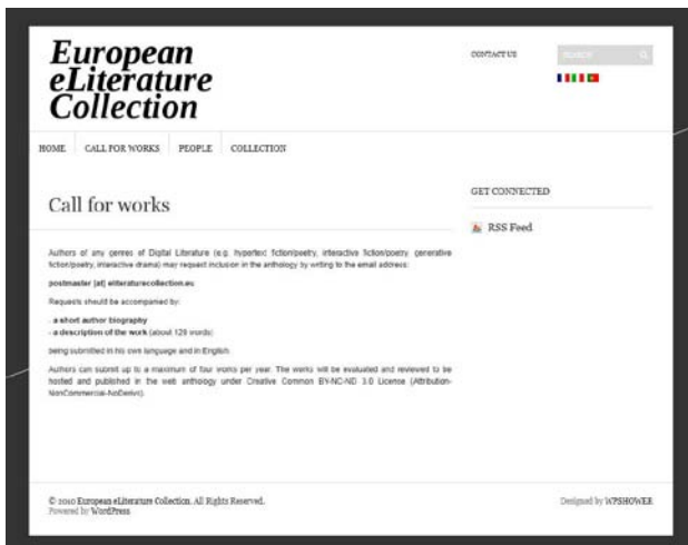
European eLiterature Collection